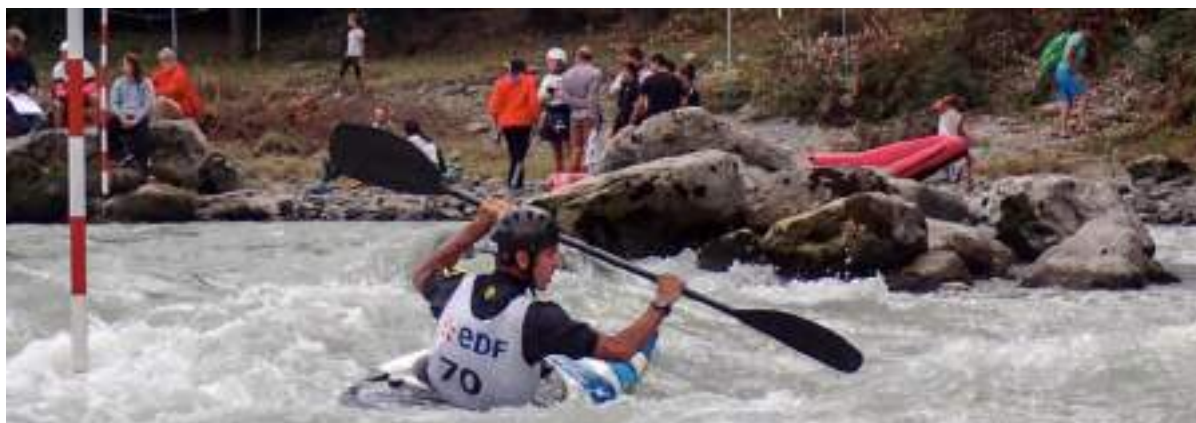
(Notre vénérable CTR lors du slalom régional d'Annemasse)

Bien entendu l'évènement majeur pour 2020 a été l'impact du corona virus.