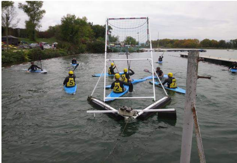
Coupe Régionale à Décines – 16 et 17 octobre 2020 – Match Haute Vallée de l’Herault I / Décines Meyzieu I