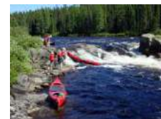
Loisir sportif /Randonnée

Les Partenaires de organisation : Ligue auvergne Rhône alpes et CD de l' ain Handi , ligue auvergne Rhône Alpes CK, EDF.