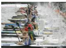
Course en ligne