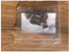
Manchons cuivre pour câble 2,5mm