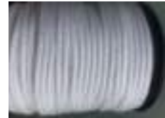
Corde polyester 5mm blanc, bobine 100m