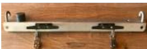
Support câble modèle vision (30x30x500mm) avec frein et taquets de réglage navette (poules non comprises)