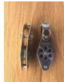
Poulie ringot inox A4 (Wichard France)