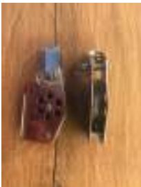
Poulie ringot-coinceur inox A4 (Wichard France)