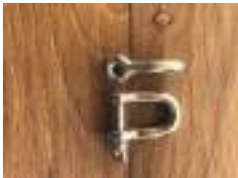
Manilles inox A4 forgées 5mm (navettes) et 6mm (câbles transversaux)