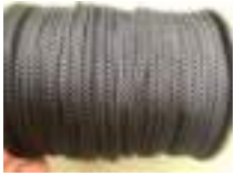
Cordelette polyester 3mm noir, bobine 100m