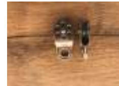
Poulie réa19 inox A4 (Wichard France)