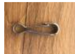
Mousqueton simple inox A4